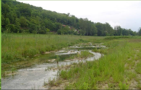
Vue sur le ruisseau réaménagé, 01/06/2006