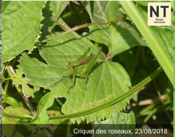
Criquet des roseaux, 23/08/2018