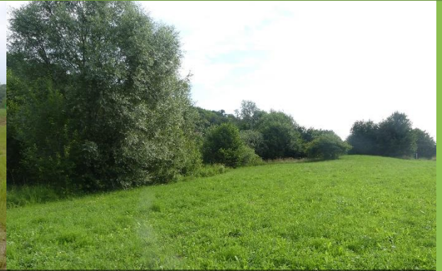
Vue sur le même ruisseau, 15/06/2018