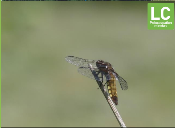
Libellule déprimée, 25/05/2018