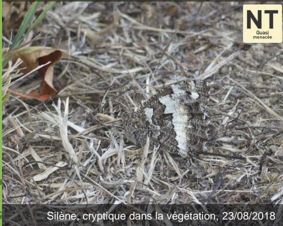
Silène, cryptique dans la végétation, 23/08/2018