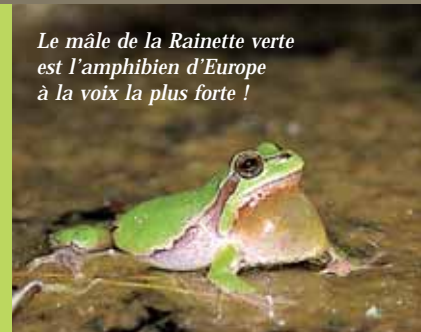
Le mâle de la Rainette verte est l'amphibien d'Europe à la voix la plus forte !

Active la nuit, la Rainette est discrète durant la journée. Elle la passe camouflée dans la végétation ou perchée dans les arbres.